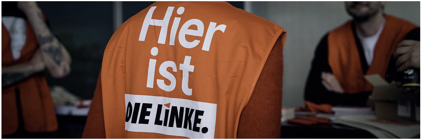
Die roten Westen des Haustürwahlkampfes 2025. 1