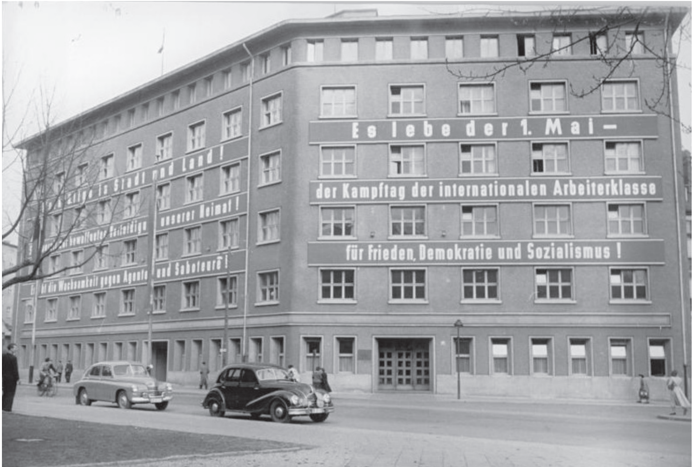
Das Berliner Karl-Liebknecht-Haus im Jahr 1955 geschmückt im Zeichen des 1. Mai. 6